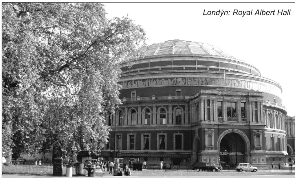
Londýn: Royal Albert Hall

„A ja, keď budem povýšený od zeme, všetkých potiahnem k sebe.“ (J 12,32)