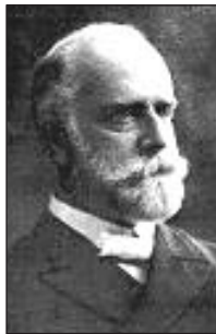
Reuben Archer Torrey (1856-1928)

O žiadnom inom predmete neučia apoštolovia tak dôrazne, jasne a často, ako o Kristovej krvi. Táto pravda naplňovala ich srdcia a bola ich ústrednou myšlienkou. Cez Kristovu krv sme sa my, kedysi ďalekí, stali blízki Bohu; Kristovou krvou sme ospravedlnení; Kristus trpel, aby nás posvätil vlastnou krvou; máme, a to naveky, vykúpenie cez Jeho krv; Jeho krv nás očisťuje od každého hriechu a Cirkev bola kúpená za túto veľkú cenu. (Ef 2,13; R 5,9; Žd 13,12; Ef 1,7; 1J 1,7; Sk 20,28; Zj 1,5; 5,9 a iné)