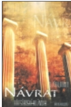
Návrat k základům křesťanského života