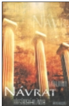
Návrat k základům křesťanského života